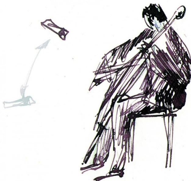
рис 2 Диапазон установки микрофонов

Специфическим и неустранимым шумом виолончели является скрипы пуговицы, в которую вставляется шпиль, такой инструмент может испортить всю запись.