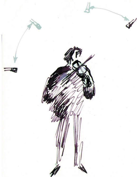
рис 1 Диапазон установки микрофонов

При записи сольной скрипки лучшие результаты получались, когда ставились два микрофона на расстоянии 15...20 см друг от друга и от 1,5 до 2,5 метров от инструмента. Микрофоны по высоте должны быть на уровне самого инструмента или чуть выше. Поднимая микрофоны еще выше и "навешивая" над инструментом ближе к оси направленности звука, можно получить более насыщенное обертонами и призвуками звучание. Звук у хорошего инструмента становится более ярким звонким. У инструмента